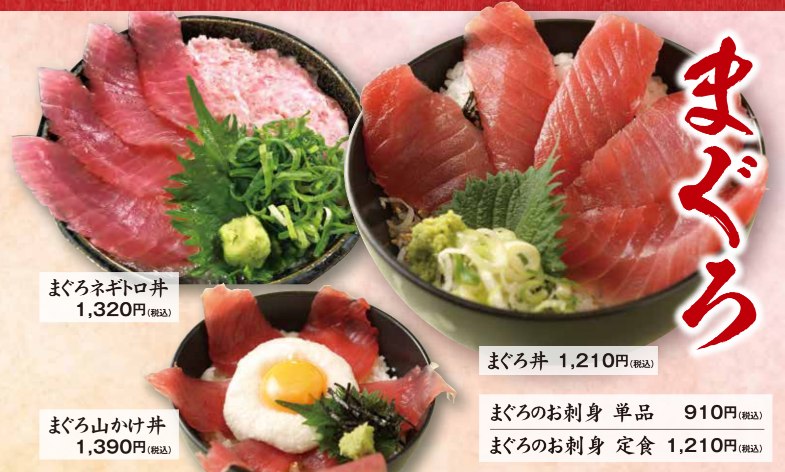
まぐろネギトロ丼 1,320円(税込)