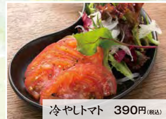
冷やしトマト 390円(税込)