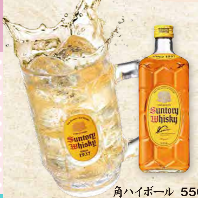
角ハイボール 550円(税込)