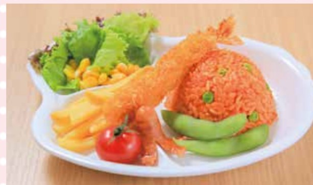
お子様セット(おもちゃ付き) 780円(税込)