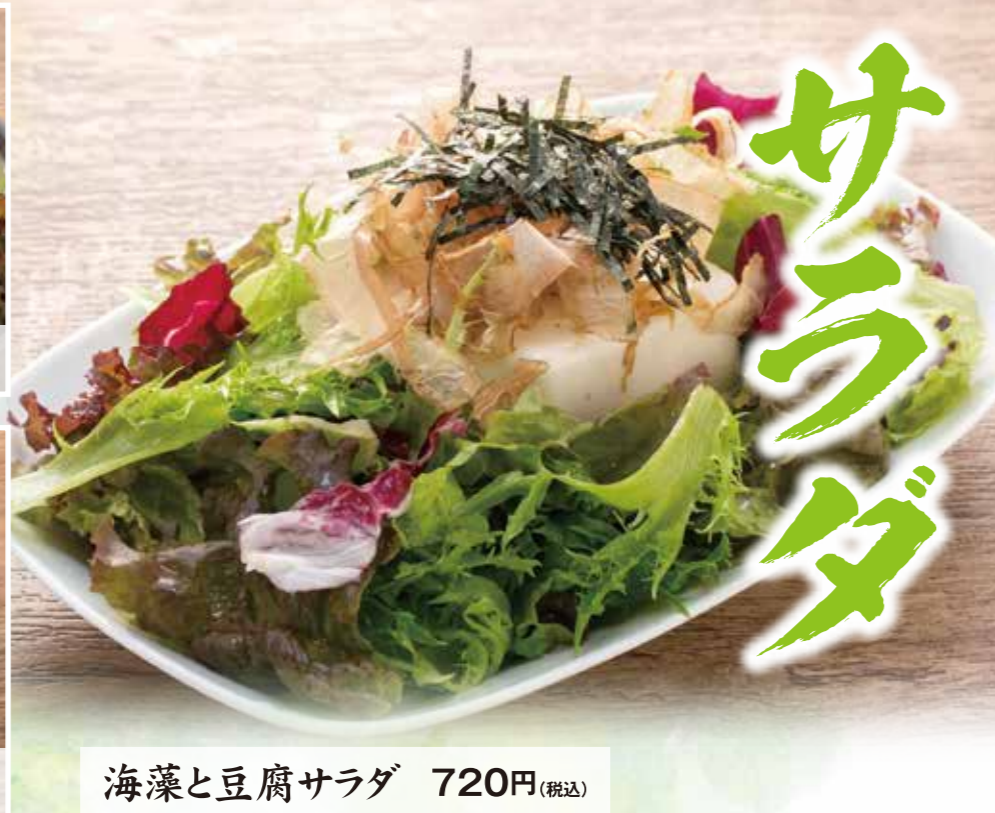
海藻と豆腐サラダ 720円(税込)