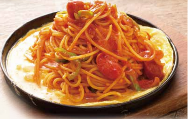
鉄板ナポリタン 900円(税込)