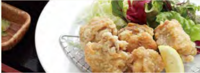
から揚げ定食(から揚げ5個) 1,080円(税込) から揚げ単品(から揚げ5個) 780円(税込)