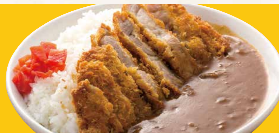
カツカレー 1,210円(税込)