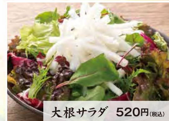
大根サラダ 520円(税込)