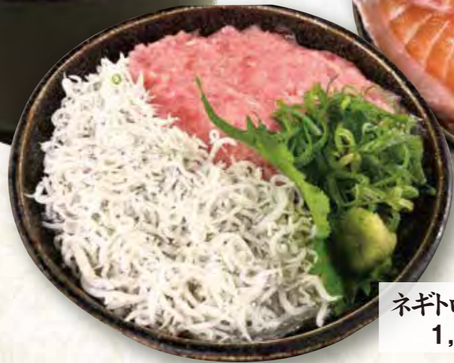
ネギトロしらす丼 1,130円(税込)