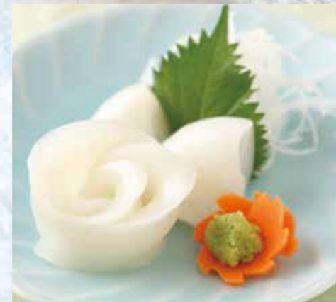
イカのお刺身 610円(税込)