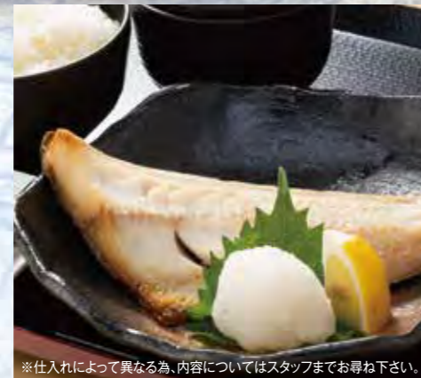
焼き魚 880円(税込) 焼き魚定食 1,180円(税込)