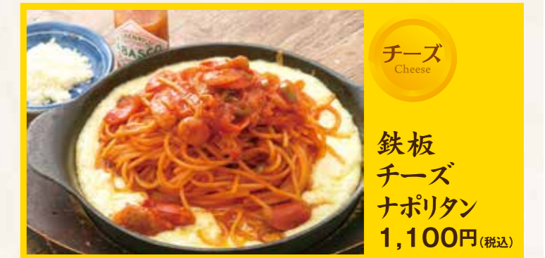
チーズ 鉄板 チーズ ナポリタン 1,100円(税込)