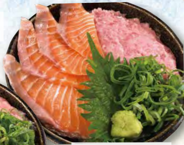
ネギトロサーモン丼 1,210円(税込)