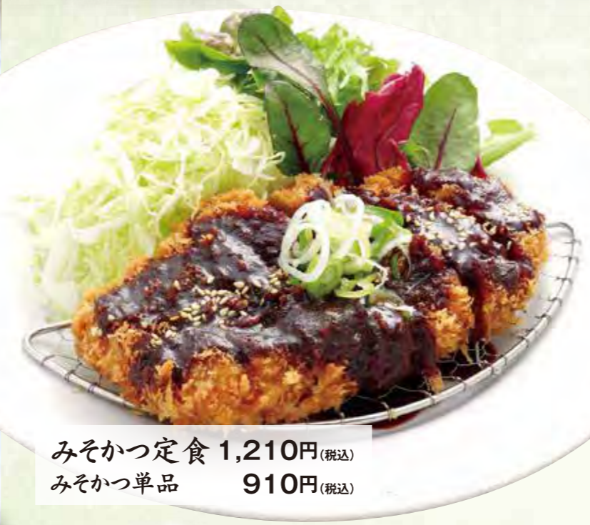
みそかつ定食 1,210円(税込) みそかつ単品 910円(税込)