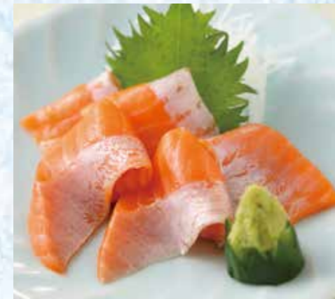
サーモンのお刺身 710円(税込)

お刺身5種定食 2,010円(税込) お刺身5種単品 1,710円(税込) お刺身3種定食 1,410円(税込) お刺身3種単品 1,110円(税込)