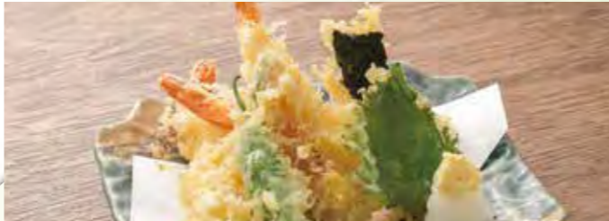
天ぷら定食(エビ・キス・野菜5種) 1,210円(税込) 天ぷら単品(エビ・キス・野菜5種) 910円(税込)