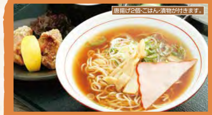
醤油ラーメン定食 1,100円(税込) 醤油ラーメン単品 900円(税込)