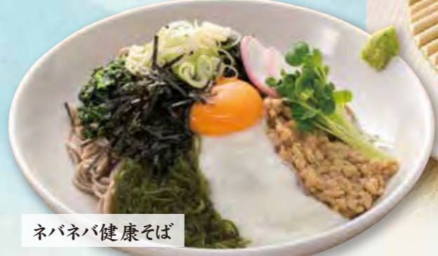
ネバネバ健康そば

そば・うどんからお選び頂けます。 温かい麺 ■ かけ 650円(税込) ■ 月見とろろ 850円(税込) 冷たい麺 ■ ざる 650円(税込) ■ 月見とろろ 850円(税込) ■ ネバネバ健康 1,000円(税込)