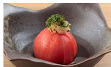
がり酢で漬けた 冷やしトマト ¥550