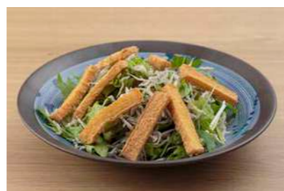
水菜とお揚げのじゃこサラダ ¥550

枝豆 ¥385 茶碗蒸し ¥330 焼き餃子 (6個入) ¥530 水餃子 (6個入) ¥530 もつ煮 ¥550