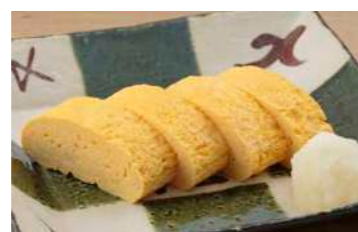
お寿司屋さんの 甘い玉子焼き ¥480