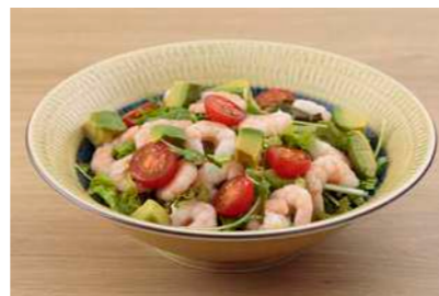
海老アボカドサラダ ¥1,045

金沢豆腐の冷奴 ¥330 金沢豆腐の揚げ出し ¥440 ほたるいか沖漬け ¥440 能登もずく酢 ¥385 能登いか糍漬け ¥385