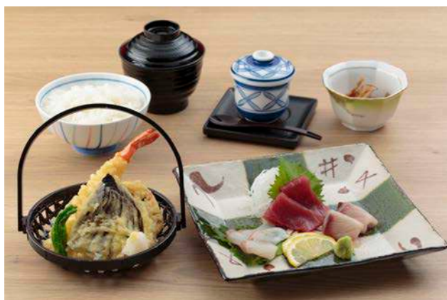
刺身・天ぷら御膳 ¥1,650