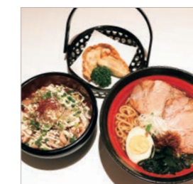
まんぷくセット B ¥1,380